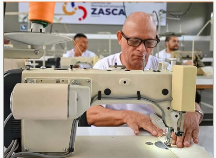
Centros de Reindustrialización Zasca / Foto por: Portafolio.co

Fuente: Portafolio. (1 de diciembre de 2023). Mincomercio e iNNpulsa ponen en marcha centros para fortalecer la economía popular.