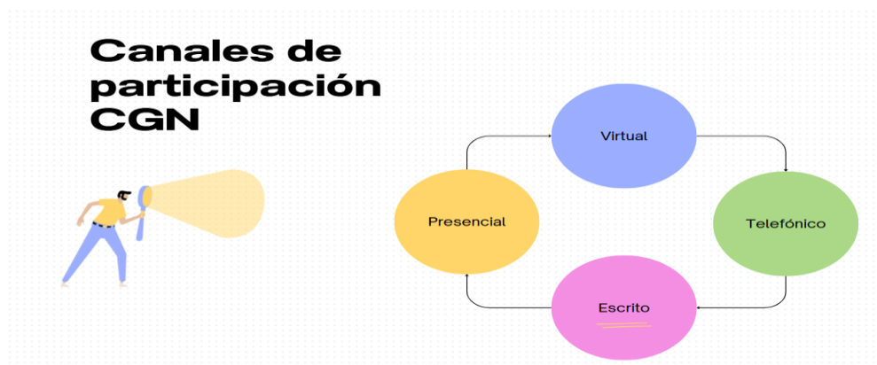
Figura 2. Canales de participación ciudadana establecidos por la CGN.

como se muestra en la figura 2, que permiten una interacción directa con la entidad. A través de estos espacios, la ciudadanía, usuarios y los diversos grupos de valor pueden acceder a la información institucional, expresar sus opiniones y contribuir con observaciones y sugerencias en la elaboración, formulación y ejecución de los planes, proyectos, programas, productos y servicios de la CGN.