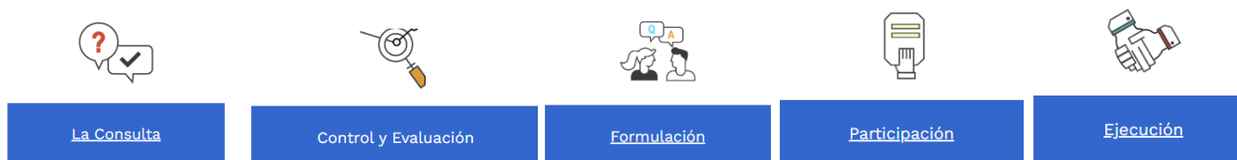
Figura 4. Niveles de participación

Los niveles de participación hacen referencia al grado de incidencia que la ciudadanía tiene para conocer opiniones, vigilar, formular, ser informado o intervenir en las políticas, planes, programas, proyectos, servicios y trámites de las diversas entidades públicas y que son establecidos por el Modelo Integrado de Planeación y Gestión (MIPG). El modelo MIPG establece 5 niveles de participación como se puede observar en la figura 4.