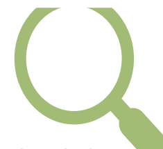
Seguimiento y evaluación