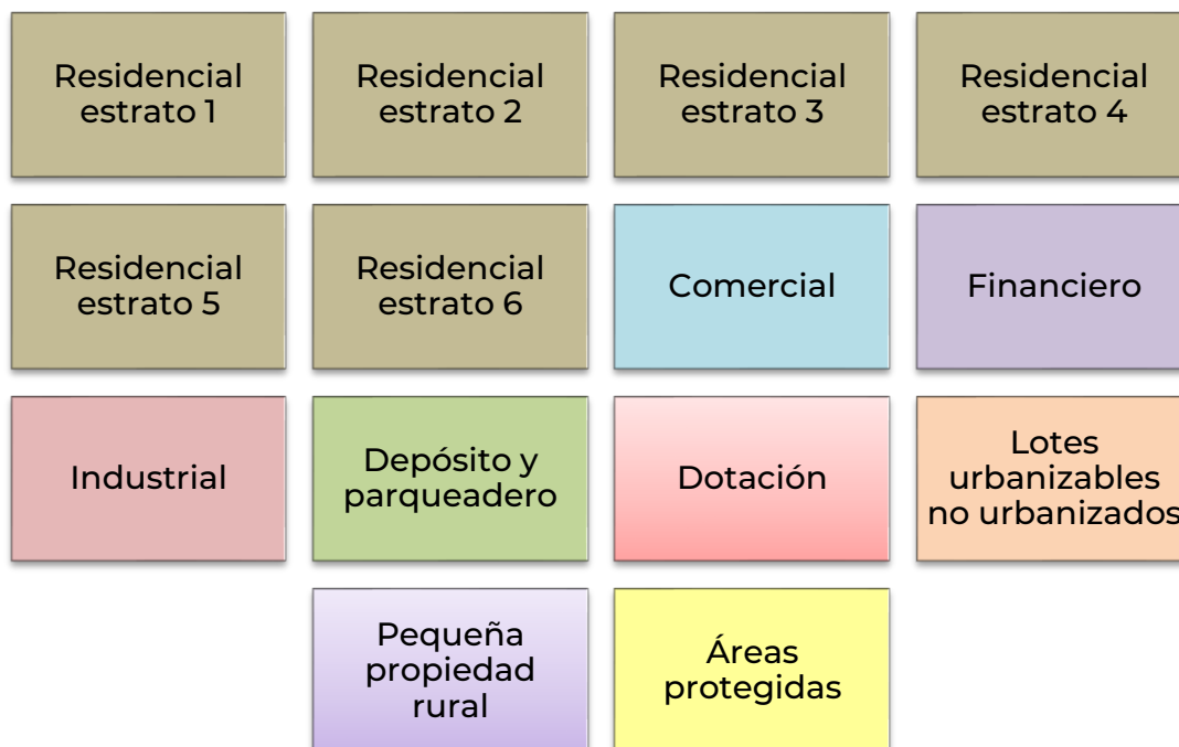
Gráfico 2. Agrupación de la cartera por impuesto predial para la estimación del deterioro

Para la estimación del deterioro de manera colectiva, se emplea una matriz de deterioro para cada grupo. Esta matriz se construye con base en el análisis histórico de tendencias de pago y de recuperabilidad de la cartera durante los diez años anteriores al periodo contable en el que se realiza la estimación para establecer los porcentajes de incumplimiento promedio por edad de la cartera.