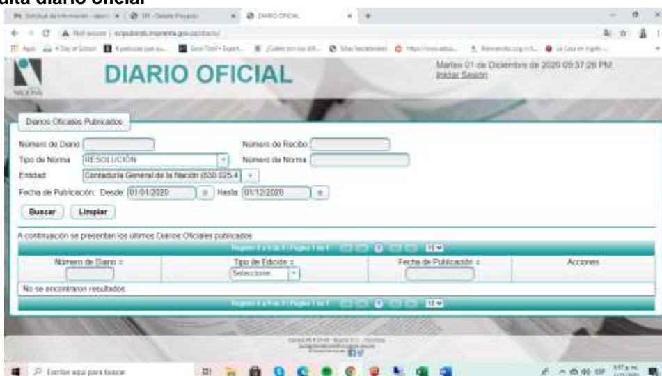
Imagen 1 Consulta diario oficial

A la fecha de presentación de este informe el GIT de Servicios Generales, Administrativos y Financieros no ha reportado el numero de los actos administrativos que ha publicado en el diario oficial, por lo que al momento de consultarse en dicha fuente la página no arroja resultados. Ver imagen 1.