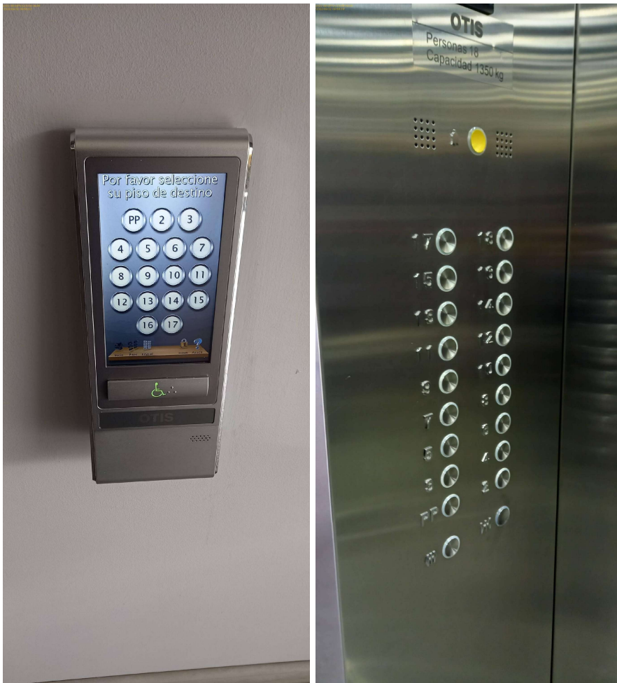
Desempeño de Calidad - Después