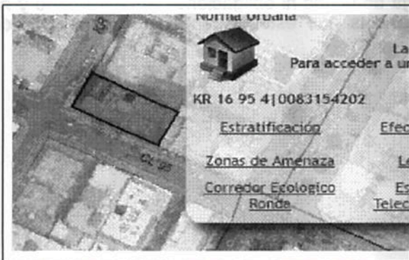
Localización del predio